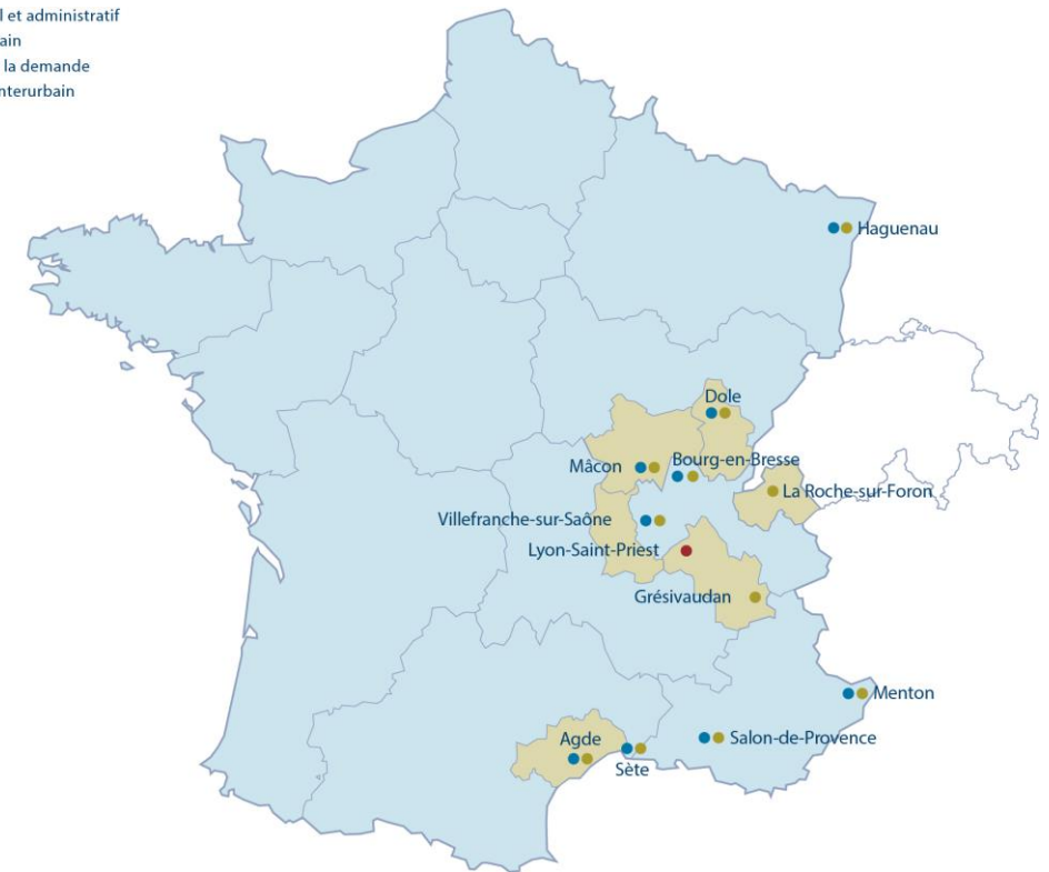
Markt International (Frankreich)